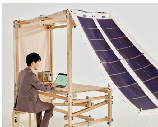
写真：屋外のテレワーク可能な「ソーラーつな木」