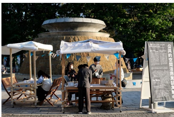
写真：露店型にアレンジしたどこでもつな木